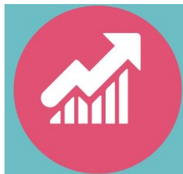
Rekordmånga besök på